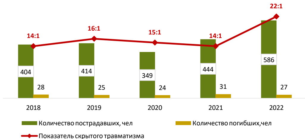
Уровень производственного травматизма