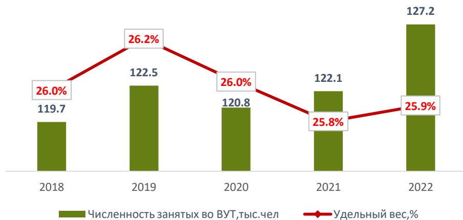
Динамика численности, занятых во вредных условиях труда